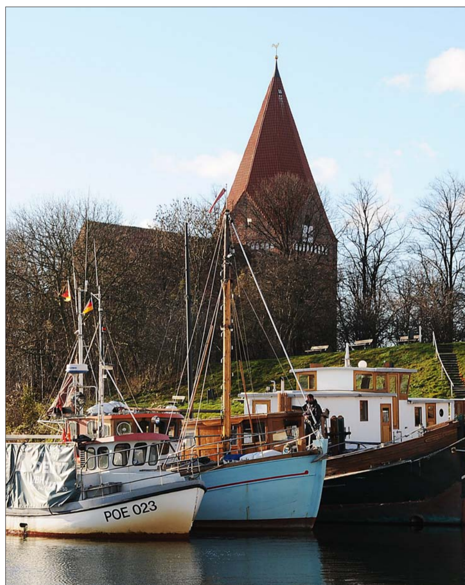
Kirchdorf auf Poel: Der 47 Meter hohe Kirchturm ist weithin sichtbar.