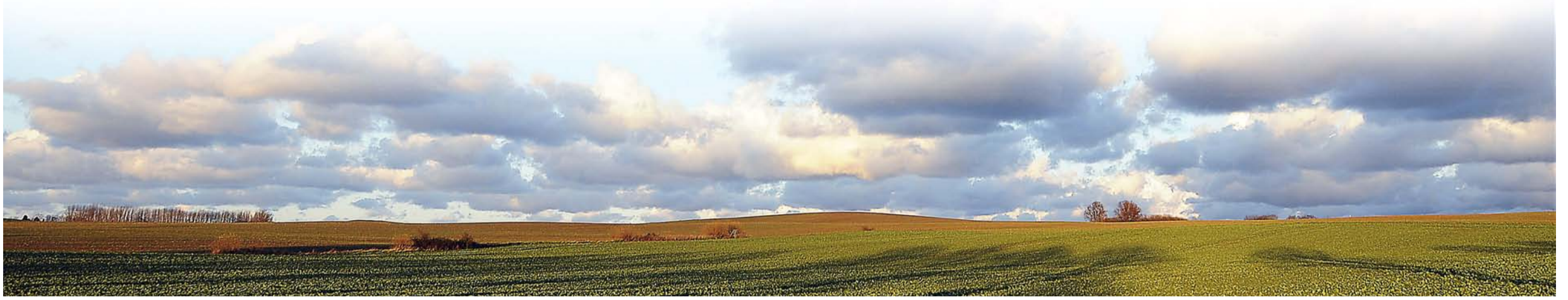
Landschaft bei Klütz: Hier in der Nähe verläuft der 54. Breitengrad Nord. Die geografische Linie durchzieht in Mecklenburg-Vorpommern eine ländliche Region, in der es aber viel zu entdecken gibt.