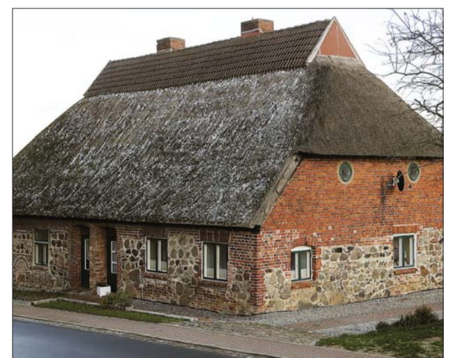
Altes Bauernhaus in Gerdshagen

Das Gutshaus Gerdshagen fand erste Erwähnung 1224 als es im Besitz des Kirchsprengels Satow war, wurde aber erst 1555 als Herrensitz derer von Oertzen ausgebaut. Danach gab es eine wechselvolle Besitzergeschichte. Seit 1999 ist es wieder im Privatbesitz. Gutshaus, Pferdestall und Park sind in die Denkmalliste des Landkreises Bad Döberan eingetragen.