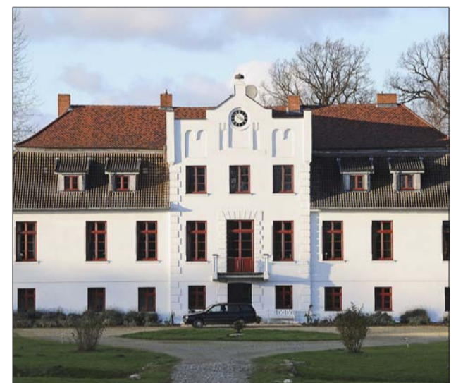
Das Gutshaus in Gerdshagen

Die Kirche in Alt Karin wurde im 14. Jahrhundert errichtet. Die unteren Mauerteile sind aus Feldstein. Das Innere der Kirche wird durch einen barocken Kanzelaltar bestimmt. In Mecklenburg begann der Kirchenbau um 1200. Bis dahin gab es nur spärliche hölzerne Bauwerke, die später oft überbaut wurden. Die anfangs entstehenden Feldsteinkirchen wurden durch leichtere Backsteinkirchen abgelöst.